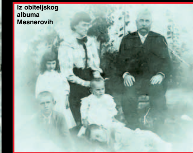
Iz obiteljskog albuma Mesnerovih

Riječ je o književniku koji daje socijalnu dijagnozu. Mesner ne gleda, on jednostavno vidi. Ne prikazuje, nego doživljava