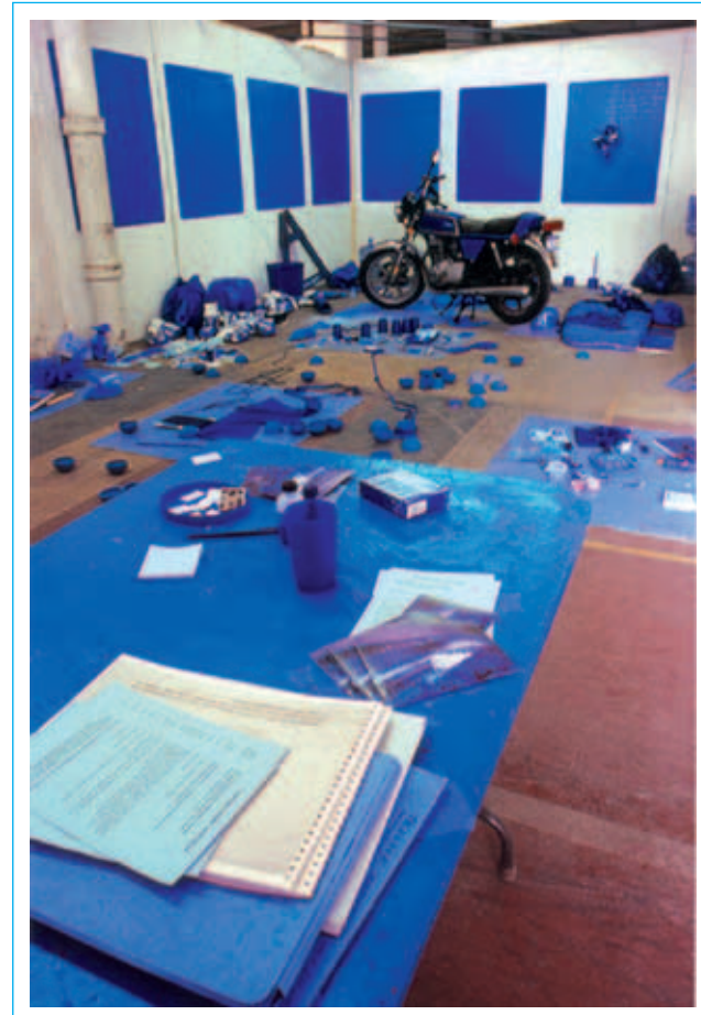
Potpisujem sve što je plavo, 2003.

Jerković je tip umjetnika koji podršku svomu radu traži i nalazi u velikim duhovnim, religijskim i filozofskim prostranstvima